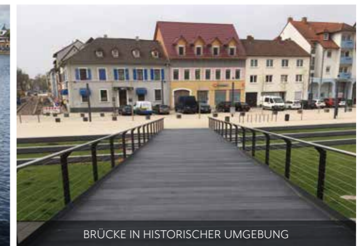
BRÜCKE IN HISTORISCHER UMGEBUNG