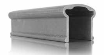
krafton® GFK Geländerprofil