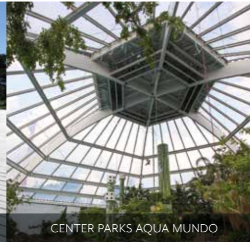
CENTER PARKS AQUA MUNDO