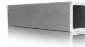
krafton® GFK Hohlprofil

Glasfaserverstärkter Kunststoff ist ein sehr langlebiges Produkt mit einer ausgezeichneten Lebenszyklusanalyse. Um das Cradle-to-Cradle-Prinzip zu fördern, bietet krafton® eine Rücknahmegarantie für alle von uns hergestellten GFK Profile an. Auf diese Weise stellen wir sicher, dass unsere Profile wiederverwendet oder umweltgerecht recycelt werden.