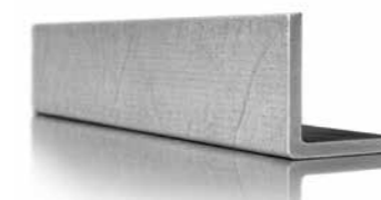
krafton® GFK Winkelprofil