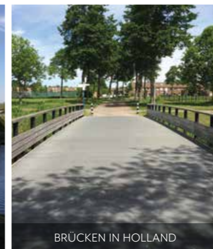
BRÜCKEN IN HOLLAND