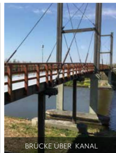
BRÜCKE ÜBER KANAL