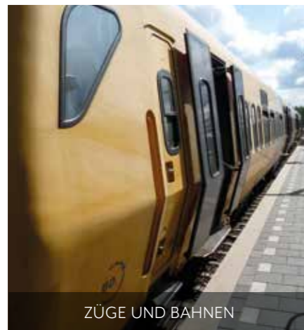
ZÜGE UND BAHNEN