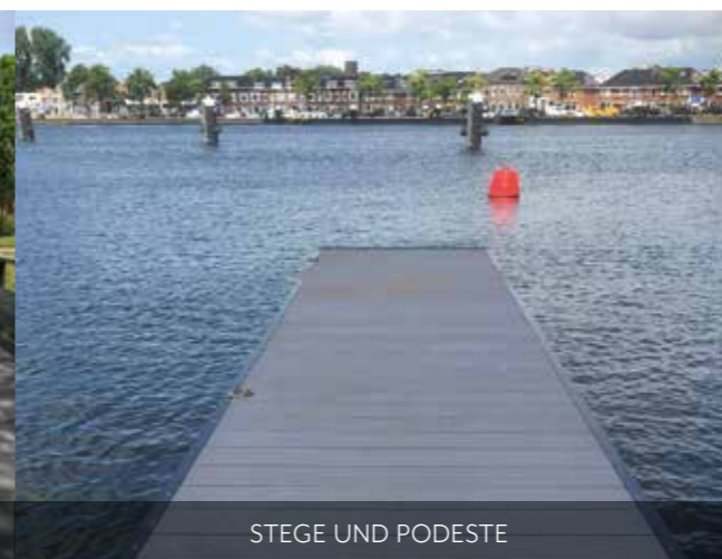
STEGE UND PODESTE