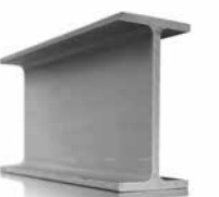
krafton® GFK I/H-Profil